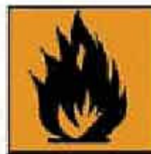
F+ = Estremamente infiammabile