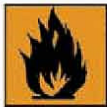
F = Facilmente infiammabile