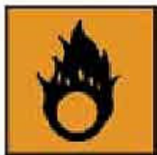
O = Comburente