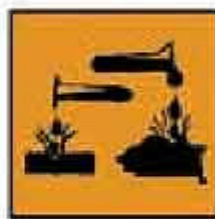
C = Corrosivo