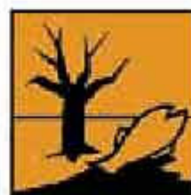
N = Pericoloso per l'ambiente

altamente tossico o molto tossico ( T+ ): un teschio su tibie incrociate. Pericoloso per l'ambiente ( N )