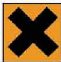
Xn = Nocivo