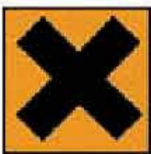
Xi = Irritante