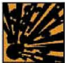
E = Esplosivo