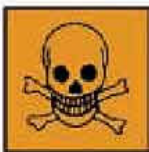
T+ = Molto tossico