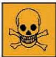
T = Tossico